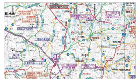
＜道路コメント（青）、観光・飲食系コメント（赤）など多種多様なコメントが入る地図＞