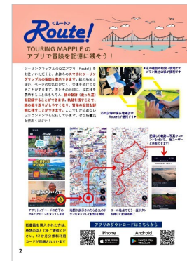
<「Route!」アプリの説明ページ>

※2 クーポンコードで使えるのはお買い上げいただいたエリアの地図です。全エリアが使える月額課金版もあります(¥600/月)。書籍に収録されている地図とアプリの地図は、収録範囲や仕様により一部異なる部分があります。また、電子書籍版にはアプリ利用コードは同梱されません。