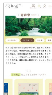
＜都道府県特設ページ例＞