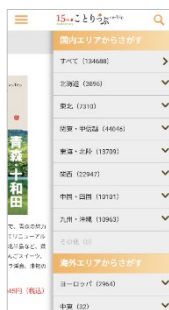
＜検索機能改良例「エリアから探す」 左：刷新前の旧ページ、 右：刷新後のページ＞