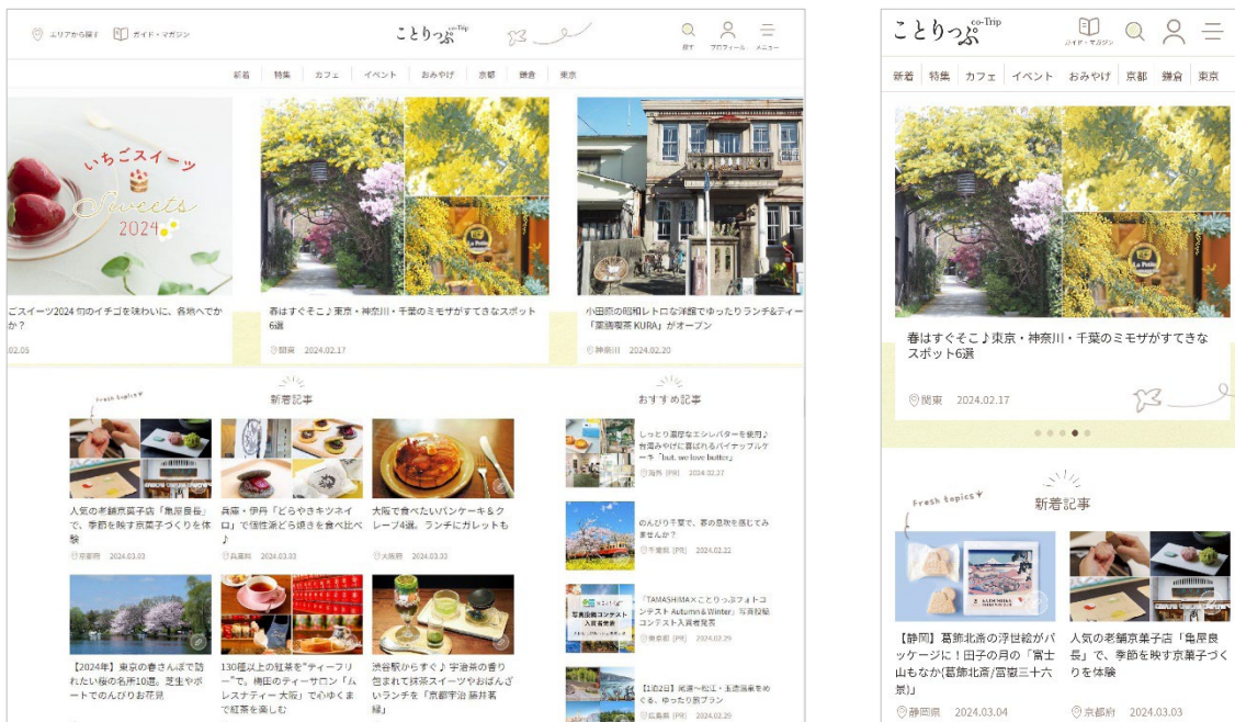
<新しい「ことりっぶWEB」のTOP 左:PC、右:スマートフォン、のそれぞれ画面例>

またリニューアルを記念し、計100名に豪華賞品をプレゼントするキャンペーンも開催いたします。