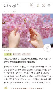
＜記事デザイン改良例＞

ことりっぷの国内・海外ガイドブック、季刊誌ことりっぷマガジン、ことりっぷ会話帖をご紹介するガイドブック・マガジンページは、ご希望の商品をスムーズに探せるようになり、各ガイド・マガジン詳細ページでは、誌面の一部を試し読みすることができるようになりました(一部書籍を除く)。