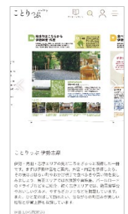
＜ガイドブック・マガジンページ例＞