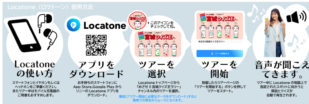
<音声 AR アプリ「Locatone™」の使用方法>