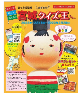
<代表誌面 3 (裏表紙) >