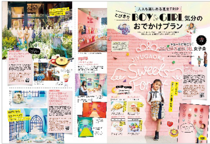
<キュートに行こう♡ MAMA&GIRL 女子>