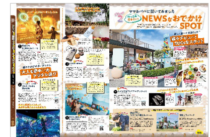
<SDGs スポット/デジタル遊び>