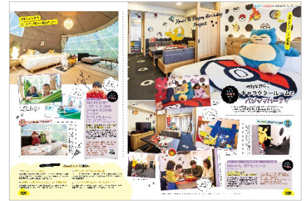
<特別な日はキャラクタールーム でパジャマパーティー>

「家族でおでかけ」ならではの最新トレンドをしっかり押さえた誌面も盛りだくさん。「冬コレ予報」では個性派ぞろいのバケーションレンタルや取り寄せたい注目ミールキットを特集。「行った&行きたい! NEWS なおでかけスポット」ではSDGs スポットやデジタル遊び、オシャレに進化する都内の公園やあのジブリパークの話題を取り上げています。