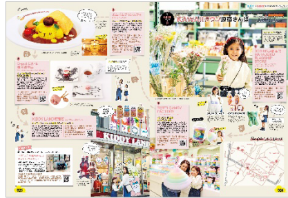
<KAWAII タウン原宿さんぽ>