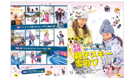
<親子スキー&雪遊び>

親子スキーや雪遊び情報、イルミネーションやイベントの記事も大充実。この冬、ご家族に<心もフツコロも暖まる、とっておきのおでかけ>をお届けする一冊です。