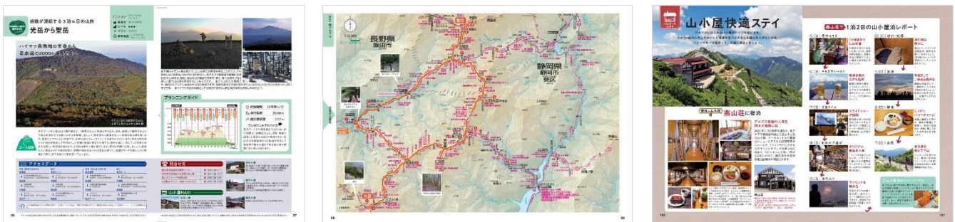
<『アルプストレッキング BESTコース』誌面例>

◆ 山小屋・テント泊のハウツー を取材したページや、安全登山に向けて 事前準備 や トラブル時の対応策 を記載したページなども掲載。読み応えのあるページ構成で、登山意欲を掻き立てること間違いなし。