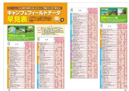
<『全国キャンプ場ガイド 東日本』誌面例>

◆ロケーションや設備の有無などで検索できる 早見表 や、位置関係が一目でわかる 広域マップ 付き。「湖畔のサイトで〇〇県にあるキャンプ場」というような探し方ができ、実用的な一冊です。