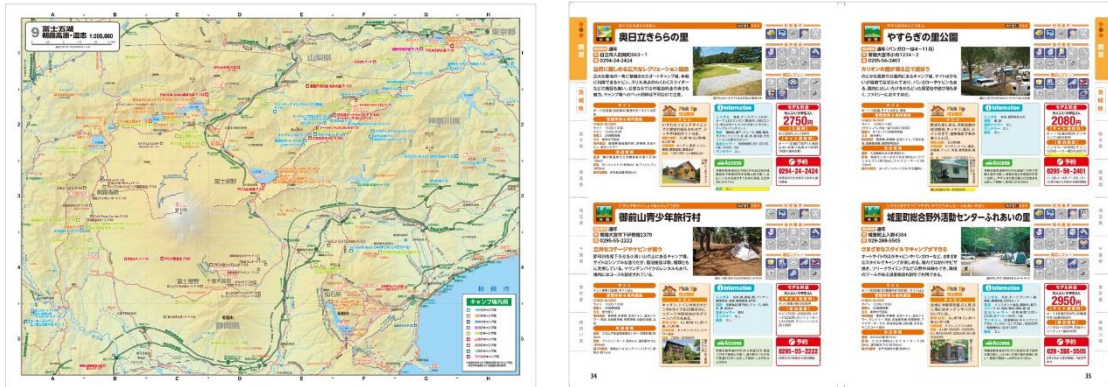
<『全国キャンプ場ガイド 東日本』誌面例>

◆スペースの都合で情報が掲載しきれない物件には 二次元コード 付き。スマホで読み取っていただくと詳細情報にアクセスできます。