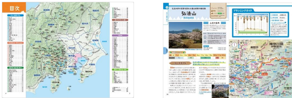
<『関東の山あるき 100選』誌面例>

◆100コース全てに用意されているコースガイドページには、道中の見どころや注意点を紹介するほか、登山の適期が一目で判断できる「 季節カレンダー 」、コースの高低差・所要時間・歩行距離など登山における重要な要素がすぐに分かる「 プランニングガイド 」も掲載。