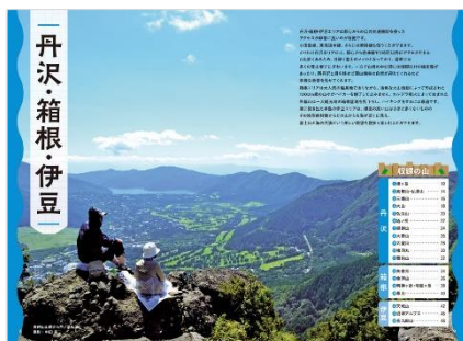
<『関東の山あるき 100選』代表誌面>

初心者の方から上級者まで誰でも安心安全な楽しいアウトドア体験をしていただきたく、以前から多くの読者様より厚い信頼を寄せられているアウトドア関連本「山と高原地図ガイド」と「全国キャンプ場ガイド」の内容を精査し、最新トレンドを踏まえて大幅改訂いたしました。なお、『山と高原地図ガイド 関東の山あるき 100選』は、2008年以来14年ぶりの改訂となります。