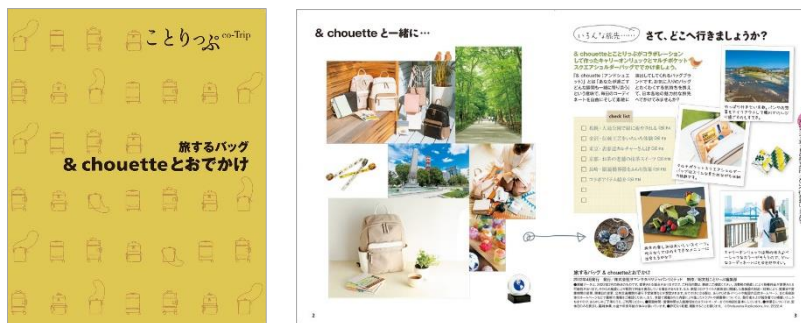
<「旅するバッグ & chouette とおでかけ」表紙と誌面例>

今回のコラボ商品の紹介と、札幌、金沢、東京、京都、長崎など、バッグと一緒に訪ねたい春におすすめの旅先のアートやカフェ、体験を紹介する、ことりっぷ編集部作成のオリジナル小冊子「旅するバッグ & chouette とおでかけ」を、4月22日より全国の& シュエット店舗にて、数量限定で配布予定です。配布店舗等詳細は、 & シュエット公式オンラインショップの特設ページ よりご確認ください。