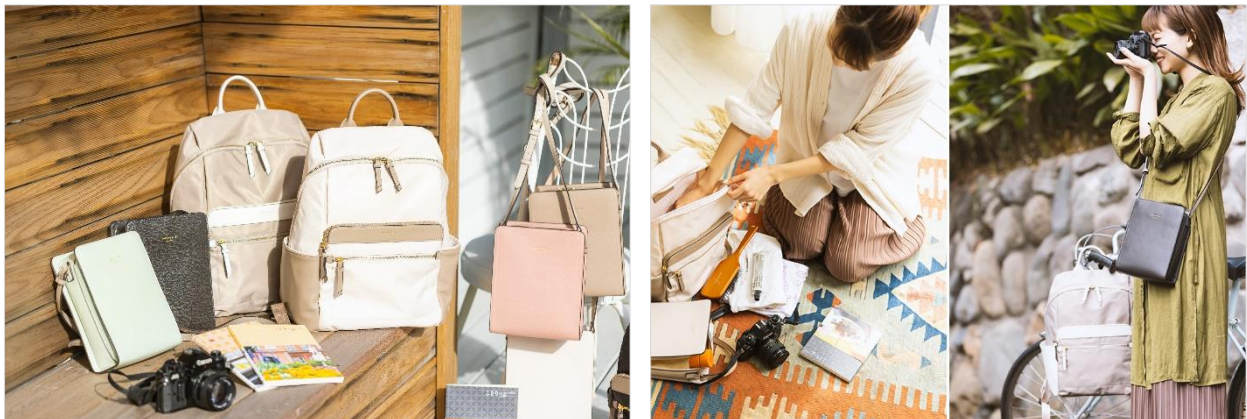
< & シュエット×ことりっぷ コラボバッグ商品 >

また今回のコラボレーションのために、ことりっぷ編集部が作成した オリジナル小冊子「旅するバッグ & chouette とおでかけ」 を数量限定で、全国の& シュエット店舗にて配布する予定です。