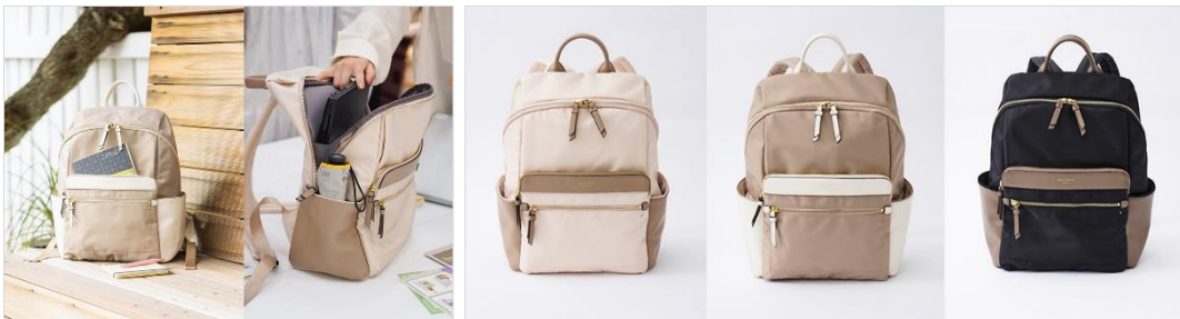
<キャリーオンリュック>

◆内面にも、A4サイズの書類や小型のノートパソコンが収まるポケットが設置され、通勤通学など普段使いにもおすすめです。