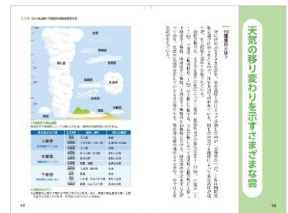
<『絶景の気象』代表誌面>