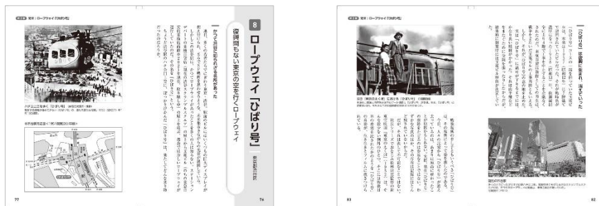
&lt;『日本の遺構』代表誌面&gt;

悠久の時を超えて姿を現した遺跡、かつてはにぎわっていた集落の跡、祭りの後に消え去った構造物……全国各地にある「失われしもの」にまつわる伝説や知られざるエピソードを集めた一冊です。多種多様な資料や文献と、遺構に関して深い知識を持つ方々よりご提供いただいた数多くの貴重な写真や図版を駆使し、「失われたもの」を取り戻すための旅へご案内します。