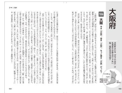
&lt;『地名の真実』代表誌面&gt;