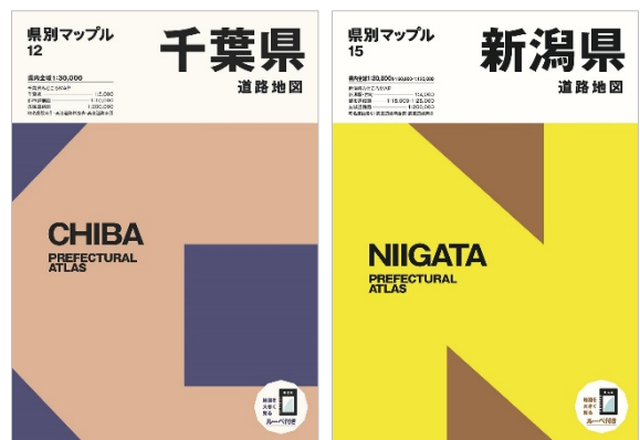
<左：「千葉県」、右：「新潟県」のそれぞれ表紙>