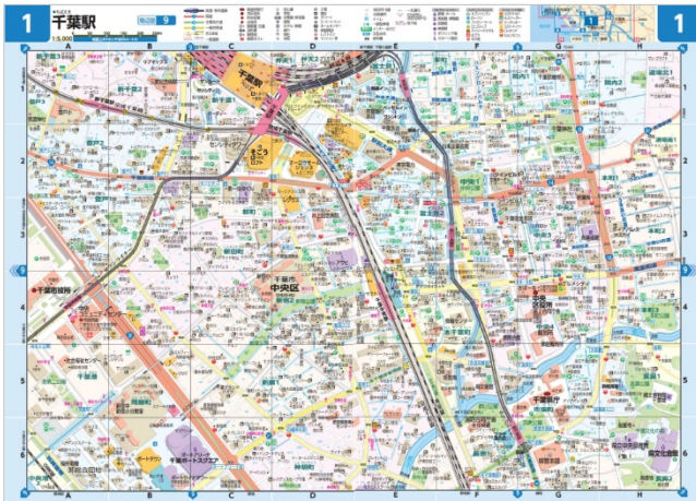
<1:5,000 中心部拡大図見本例>