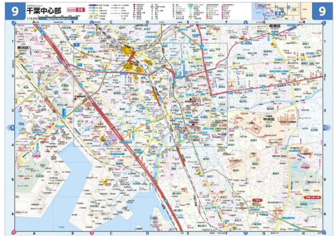
<1:10,000 都市詳細図見本例>