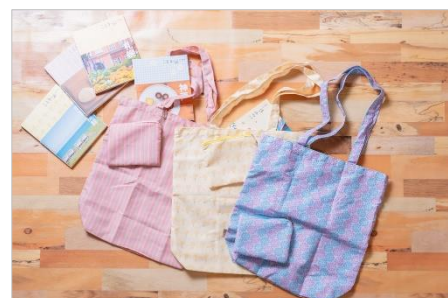
<「ことりっぷコラボエコ BAG」商品画像>

商品名:「ことりっぷコラボエコ BAG」 種類:イエロー(千葉)・ブルー(鎌倉)・ピンク(小布施) 価格:各2,090円(税込)