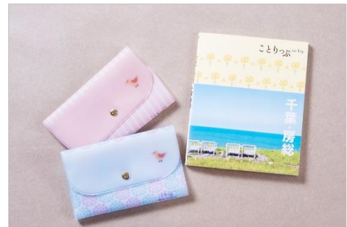
&lt;「ことりっぷコラボマスクポーチ」商品画像&gt;