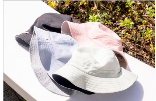
&lt;「ことりっぷコラボリバーシブル HAT」商品画像&gt;