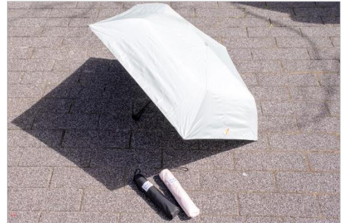
<「ことりっぷコラボ折傘」商品画像>