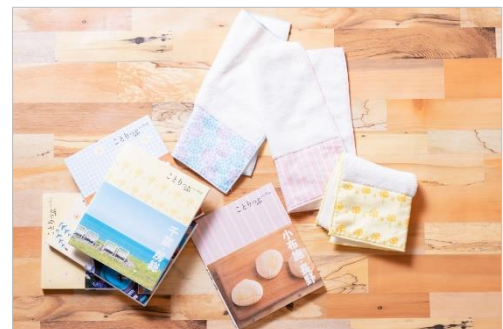
&lt;「ことりっぷコラボハンカチ」商品画像&gt;