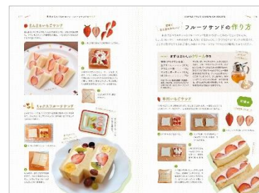
<「身近なフルーツサンド食べ比べ」誌面例> <「フルーツサンドの作り方」誌面例>