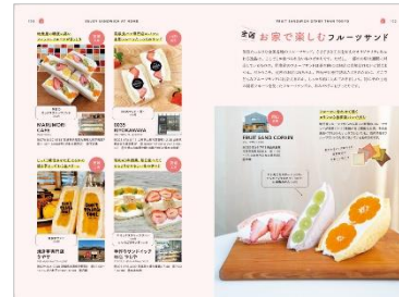
<「全国のフルーツサンド」誌面例> <「全国お家で楽しむフルーツサンド」誌面例>

読み物としてもお楽しみいただけるコンテンツもさらに充実！「フルーツサンド研究」特集の「身近なフルーツサンド食べ比べ」「フルーツサンドの作り方」「フルーツサンドクロニクル」など、フルーツサンド愛たっぷりでお届けします。