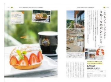
<「東京のフルーツサンド」誌面例>