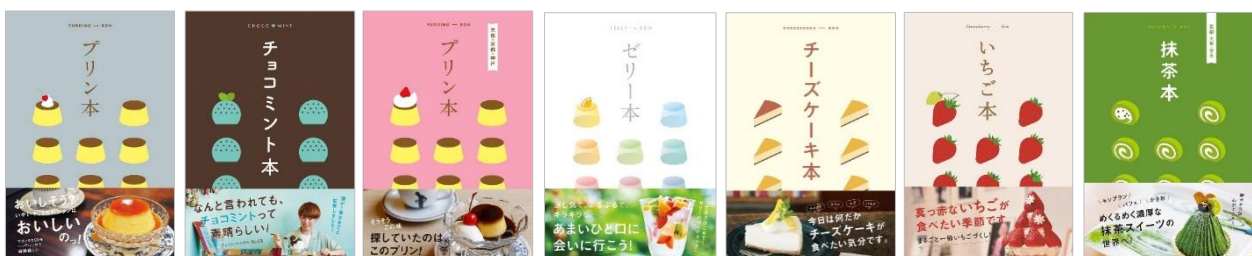
<シリーズ既刊表紙一覧>