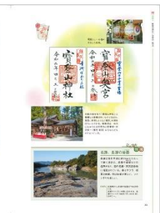
<寶登山神社代表誌面>

【リリースに関するお問合せ】 株式会社 昭文社ホールディングス 広報担当：竹内、張