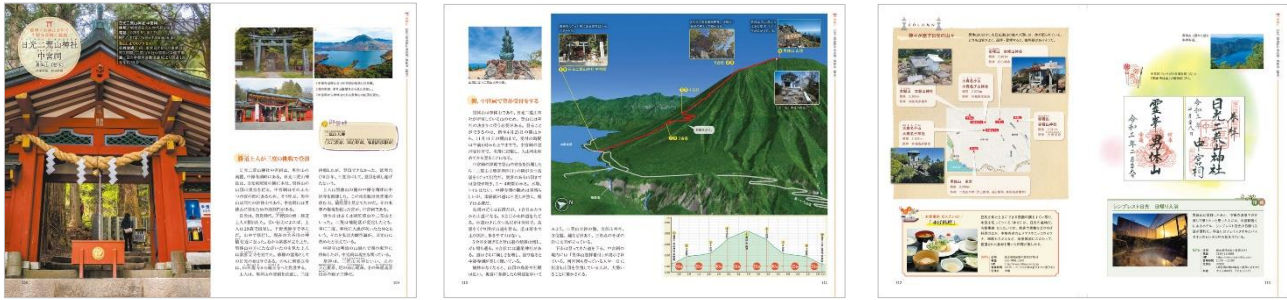
<日光二荒山神社代表誌面>