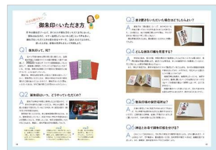
<「今さら聞けない 御朱印のいただき方」代表誌面>