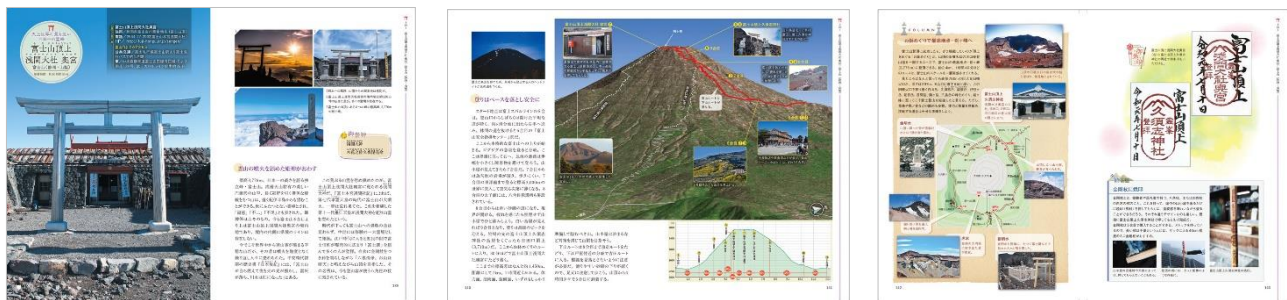
<浅間大社 奥宮代表誌面>