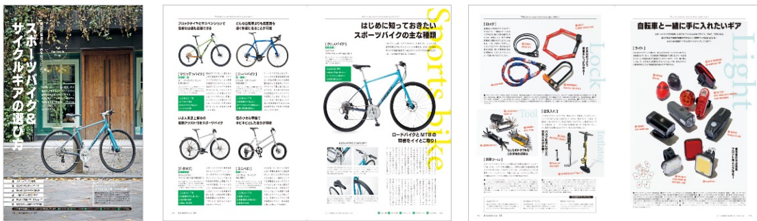
<「スポーツバイク&サイクルギアの選び方」代表誌面>

自転車に興味を持ち始めた初心者にも、値段もスペックも最適なクロスバイクの選び方を中心に、マウンテンバイク、ロードバイク、人気の小径車、E-BIKE など種類ごとにカタログスタイルでラインアップしました。必要なギア類やサイクルウェア紹介もあります。