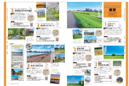
<WEEKEND CYCLING Guide20>