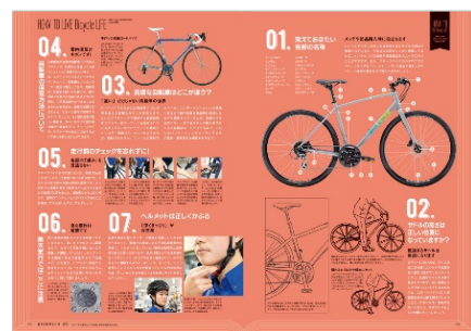
<「自転車 LIFE のために知っておきたいモノ・コト☆40」代表誌面>

等々、ゆるっと自転車ライフを始めたい方が気になる 40 の<アレコレ>をまとめてみました。