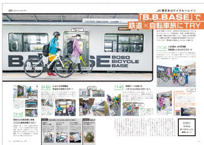
<「あこがれのチャリ旅にチャレンジしよう。」代表誌面>

普段使い用にほどよい距離のサイクリングスポットも、東京・千葉・神奈川・埼玉のエリア別に20カ所ご紹介しています。