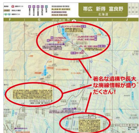
<ファン垂涎の廃線跡を現在の地図上で再現>