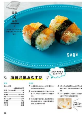
<「海苔弁風おむすび」代表誌面>