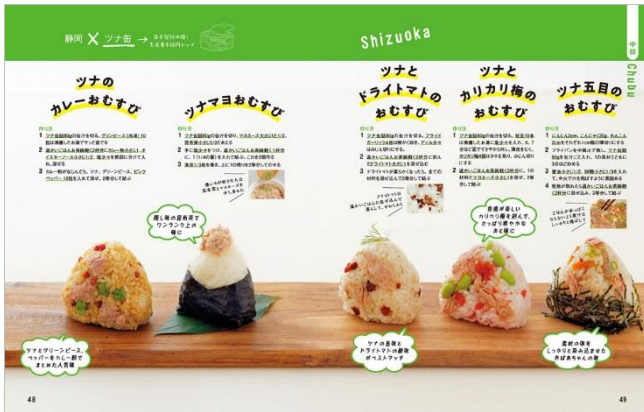
<「静岡×ツナ缶」代表誌面>