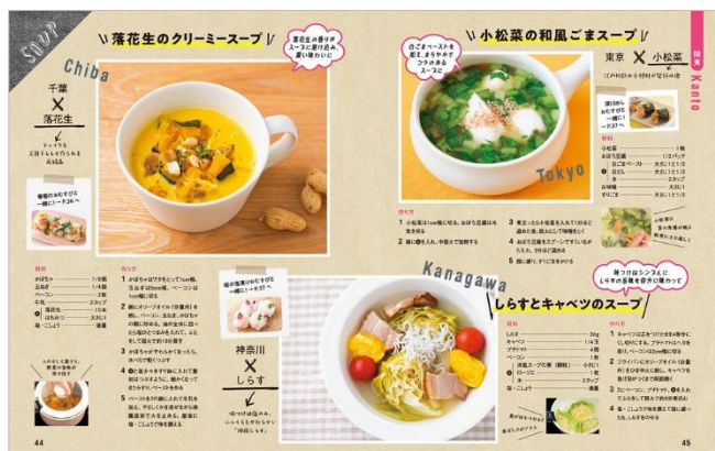
<関東スープ代表誌面>

【リリースに関するお問合せ】 株式会社 昭文社ホールディングス 広報担当：竹内、張 TEL：03-3556-8124 | FAX：03-3556-8164