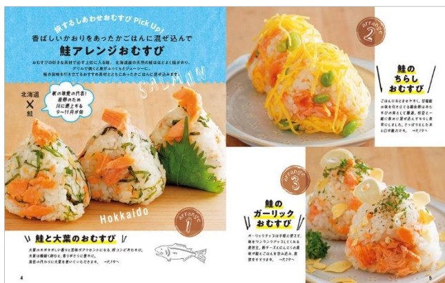
<「鮭アレンジおむすび」代表誌面>

食欲をそそる写真と簡潔な解説といったレシピ本ならではの魅力を生かしながら、新作レシピや新たに撮り下ろしたグラビアなど新規コンテンツを追加してご紹介。大人から子どもまで家族で楽しんでいただけるように仕上げました。