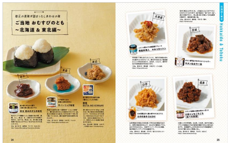
「ご当地 おむすびのとも～北海道&東北編～」>

コラム「ご当地 おむすびのとも」にて、都道府県ごとにピックアップしたおともも、本書の注目ポイントになります。すぐにでも味覚の空想旅に出かけられるよう、お取り寄せができるものを中心に紹介しています。