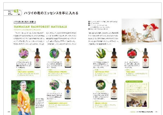
＜ハワイの花のエッセンスを手に入れる＞