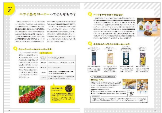
＜ハワイ島のコーヒーってどんなもの？＞