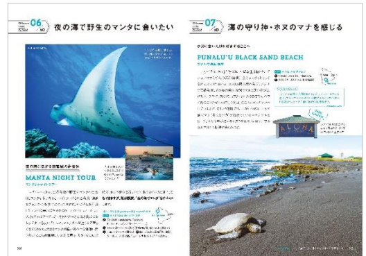
＜夜の海で野生のマantaに会いたい ほか＞

ハワイ島の素敵なものを持ち帰る ハワイアンフラワーの服を着てみる 島のオシャレ番長に会いに行く ロコが作るアクセサリを身に付ける 一生モノのラウハラを手に入れる ロコキッズ御用達の店で服を調達 ハワイの花のエッセンスを手に入れる ハワイ島にしかないスーパーを探検 レトロなジェネラルストアを巡る 理想のハワイ島産チョコを見つける コーヒーに合うクッキーを持ち帰る ブックストアで掘り出し物を探す 素敵なアンティークにときめく ハワイアンキルトの世界にふれる など