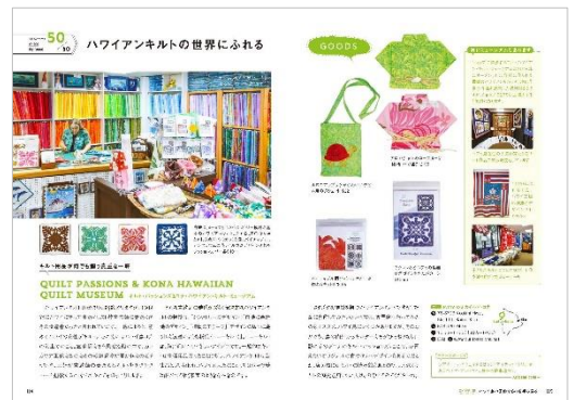
＜ハワイアンキルトの世界にふれる＞