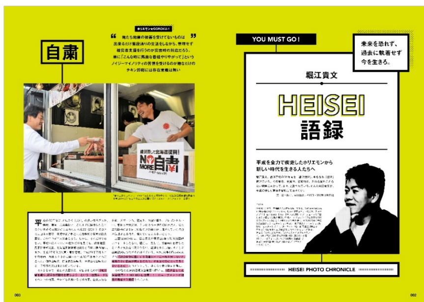
<「堀江貴文 HEISEI 語録」>