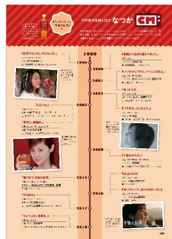
なつか CM <午後の紅茶編>