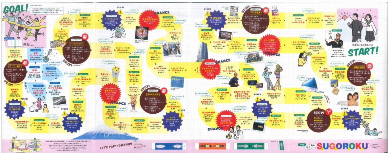
<繰り込み付録「平成 SUGOROKU」>