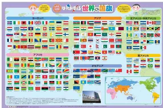
〈なるほど kids (ポスター) はっておぼえる 世界の国旗〉