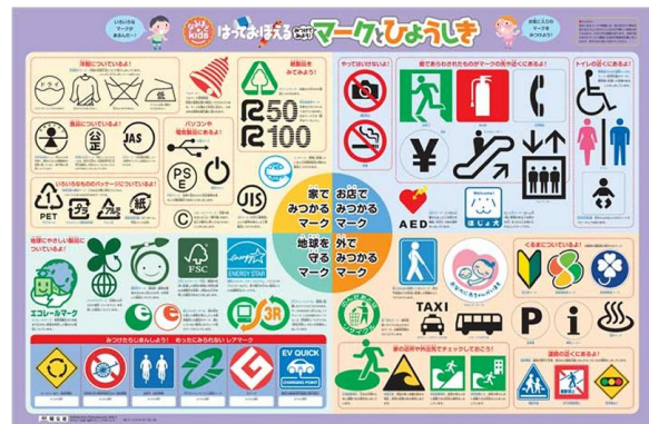
〈なるほど kids (ポスター) はっておぼえる マークとひょうしき〉