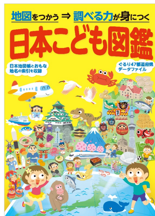
<左「世界」、右「日本」の各表紙>