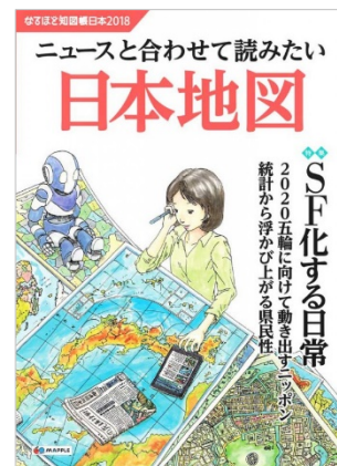
〈なるほど知図帳日本 2018〉