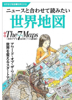
〈なるほど知図帳世界 2018〉