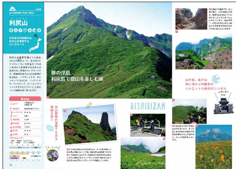
<写真&基本データ頁>

北海道、東北といった各エリアの末尾には「おすすめ立ち寄りスポット」コーナーを設け、見る・遊ぶ、買う、グルメのジャンルごとにスポットを掲載。下山後のお楽しみもしっかりサポートしています。