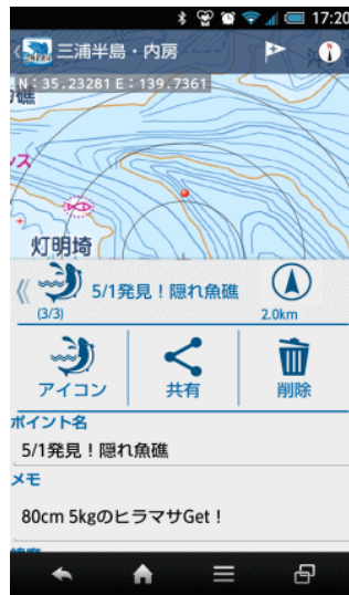
【爆釣ポイントに登録】