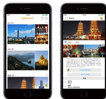
<エリア選択画面(左)、観光情報(右)>

QRコードをかざすことで割引等のサービスを受けられるクーポンの配信や、地図上で目的地の方向を示す機能、ホテル予約連携など、旅に役立つ新機能の実装を7月中に予定しています。