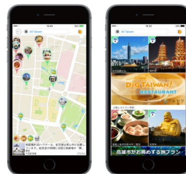
<地図画面(左)、レストラン予約(右)>