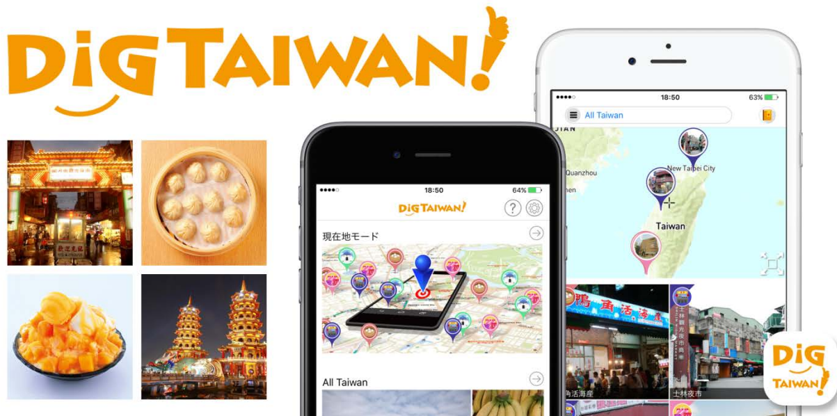
<無料観光台湾アプリ DiGTAIWAN!>

株式会社昭文社（本社：千代田区麹町、代表取締役社長 黒田茂夫、東証コード：9475）は、日本を含む近隣のアジア諸国から台湾を訪れる旅行者をターゲットとした新たな無料観光ガイドアプリ「DiGTAIWAN!(ディグタイワン)」のサービスを、台湾で地図やガイドブックを出版している大興出版社との共同サービスとして2016年5月26日よりスタートすることをお知らせいたします。