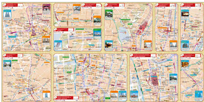
<『TOKYO 東京 Tourist Map』地図本体（裏）>

また、詳細地図は、主要観光エリアを色づけして視認性を良くしたり、著名なスポットの写真を掲載したりして、目的地をイメージしやすいようにいたしました。