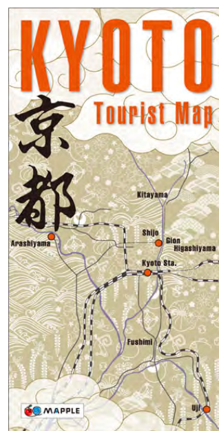
<『KYOTO 京都 Tourist Map』表紙>

2020年を前にして早くも訪日客数2000万人を超える勢いを見せ、インバウンド市場が盛り上がっています。FITと呼ばれる個人旅行客の割合も増加し、オリジナルな旅程を組み立てて楽しむというニーズが高まっています。