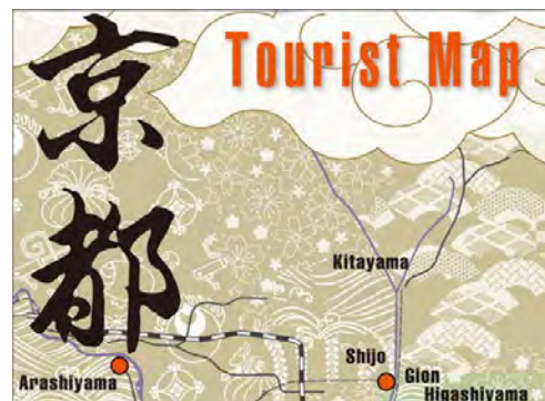
<和テイストのデザイン>

また、日本を旅行している雰囲気盛り上げるため、全体のデザインを日本らしく 和テイスト に統一しました。