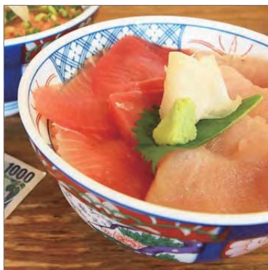
<タイ人向けワンコイン日本食>

注目のニューオープンスポットや、海外で話題になっている 流行のアイテム などを、各国エディタがいち早く取材してご紹介する「国別記事」。コスパを意識するタイ人向けにワンコインでも楽しめる日本食を紹介したり、エンタメに関心の高いアメリカ向けに世界から絶賛される阿波踊りパフォーマンスの体験記をご紹介したりと、 国ごとのニーズを満たす記事 をお届けします。