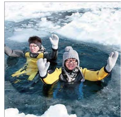
<中国人向け流水体験案内>