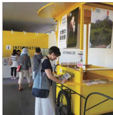
<アメリカ人向けアートイベントレポ>