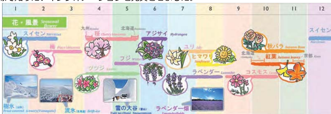
<イベントカレンダー一例>

成田空港から東京までの行きかたはもちろん、回転寿司の楽しみかたや靴のサイズの選びかたまで、外国人目線で知りたいインフォメーションを充実させました。