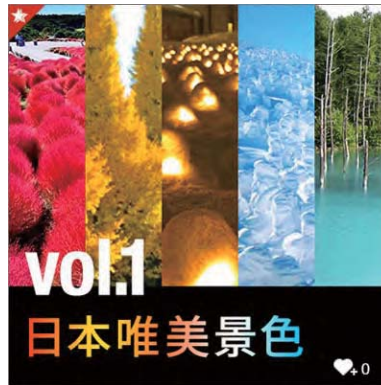
<色で楽しむ日本の絶景>