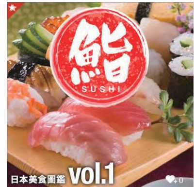
<ニッポン美食図鑑>