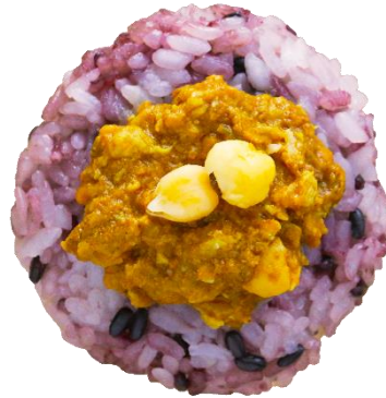
「ひよこ豆のバターチキンカレー」 たっぷりのチキンとひよこ豆をじっくりコトコト。辛さ控えめな優しい味わいのドライカレーです。 (税込200円)