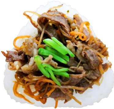
「和牛と根菜 すき焼き仕立て 生七味添え」 和牛を使った贅沢おにぎり。牛蒡や蓮根などの根菜もたっぷり入って食物繊維も豊富。青唐辛子を使った生七味がピリリといい仕事しています。 (税込330円)

お客様からリクエストの多かったお肉メニューは、厳選和牛を使ったすき焼き風のおにぎりや、沖縄定番具材のスパムおにぎりなど、ボリュームで食べ応え十分な一品となっております。