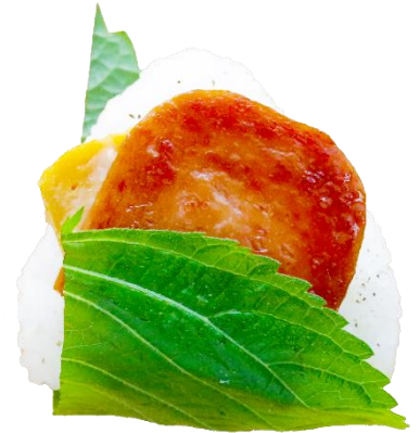
「スパム玉子 エゴマの香り」 スパムの照り焼きとTAROの玉子焼きで食べ応え満点。くると巻いたエゴマの香りが広がります。 (税込280円)