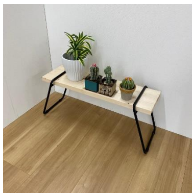
インテリアラック