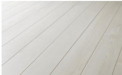
〈新色〉ネオホワイト