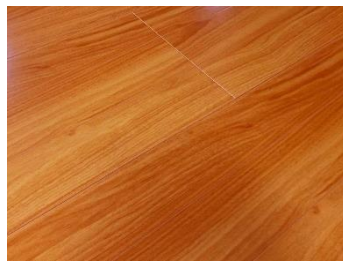
輝ミディアム(落ち着いた色味)