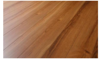
〈新色〉ティーブラウン