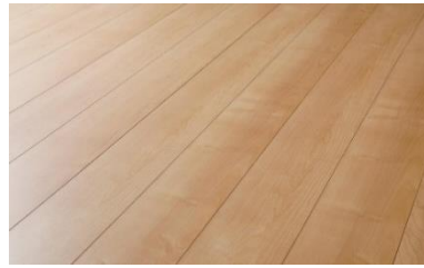
〈新色〉ミルベージュ