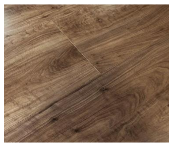
〈新色〉ウォールナット