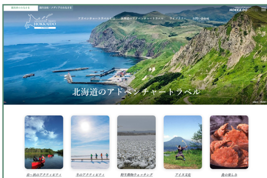
北海道のATの魅力を発信

北海道観光振興機構では2023年9月11日～9月14日にアジア初開催となる「アドベンチャートラベル・ワールドサミット(ATWS※1)2023」の北海道開催を前に北海道のアドベンチャートラベル(AT※2)の魅力を伝えるため、英語版サイトに続き日本語版サイトを2023年2月3日にオープンしました。