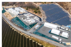
米倉山技術研究サイト