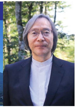
山梨県知事・特別顧問 21世紀アカデミア学長 田坂広志氏