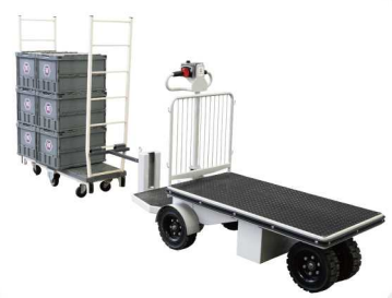
※オプション 牽引金具付き