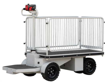
※オプション 3面柵付き