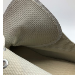
ライニングにはキャンブレルを使用