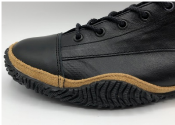
フォクシングテープにスエードを採用