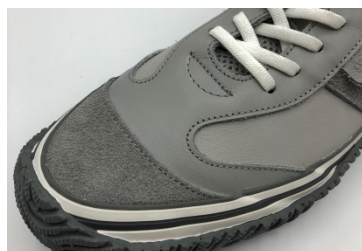
カンガルー革、牛スモース、牛ペロア 3つの素材

アッパーが内羽根のデザインで若干タイトなフィッティングのため、脱着のしやすさを考慮して伸縮性のあるゴムのシューレースを採用しています。