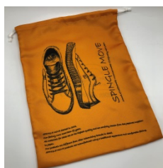
特製シューズバッグ