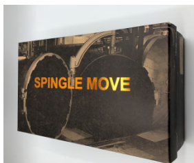
専用スペシャルボックス

今回の20周年記念の2モデルは、広島県府中市の本社工場にあるバルカナイズ製法の釜をプリントした専用スペシャルボックスに入っています。さらに、20周年記念ロゴをプリントしたインソールをはじめ、2022SSシーズンテーマ「Re;sort/リゾート」になぞらえ、リゾート地へ旅立つ空港の手荷物検査のX線画像をイメージしたプリントの特製シューズバッグや、特製の本革製ルームシューズがついています。