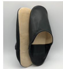
特製ルームシューズ