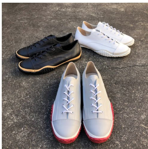
SPINGLE MOVE 「SPM-1001」

なお、当社では、2022年を記念すべき節目の年とし、今回の2モデルを皮切りに、20周年記念企画のスニーカーを順次発売していく予定です。