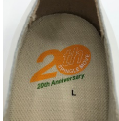
インソールにはクールマキシム