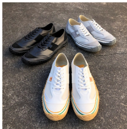
SPINGLE MOVE 「SPM-1002」

展開商品は、2008年に発表された「SPM-221」をドライビングシューズとして再構築した「SPM-1001」と、2003年発表の「SPM-501」を異なる3種類の革を組み合わせて仕上げた「SPM-1002」です。