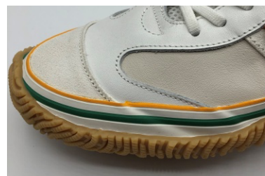
フォクシングテープにコーポレートカラーのライン