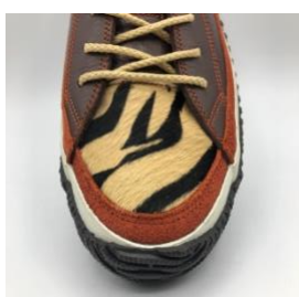
オリジナルの虎柄毛付き牛革