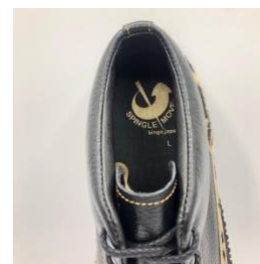
黒のライニングとインソール、金ロゴ