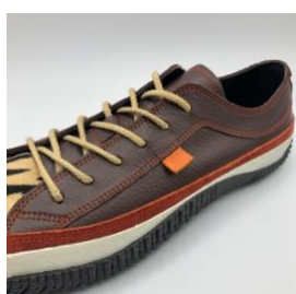
オレンジのスエード、ステッチ、ブランドネーム