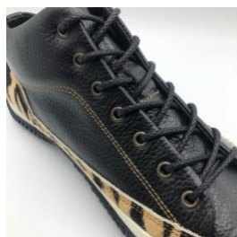
イエローステッチとブラックの蠟引き丸紐