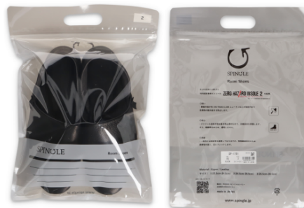
スペシャルパッケージ(表・裏)