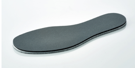
「ZERO HAZARD INSOLE2」

踏み抜き防止インソール「ZERO HAZARD INSOLE2」は、釘やガラス、がれきなどの危険物の踏み抜きを防止する素材となっています。さらに足裏全体を保護するだけでなく、絶縁素材のため感電の危険から身を守れます。また、特殊繊維素材のため軽量かつ柔軟性が高く、足にフィットするため災害発生時には履いたまま屋外に出て避難することができます。