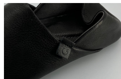
スピングルマークのピスネーム

アッパー、インソールの表面には上品な見た目のソフトな牛革を使用。サイドにはスピングルマークの型押しが入ったピスネームが付き、カカトは立ててルームシューズとして、踏んでスリッパとしても履ける2WAY仕様です。ギフトとしても喜ばれるスペシャルパッケージに入っています。