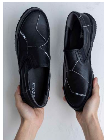
アッパーのデザインは左右非対称

この取り組みに際し、刺し子アーティストの JunAle（ジュンアレ）氏に監修を依頼。襦袢の概念は、革が持つ傷や皺に落とし込み、通常では弾くそれらの革もこのモデルでは個性として楽しんでいただくことを目的としています。また、それらを縫い、繋ぐステッチは、刺し子をイメージして施しました。ところどころに、ジグザグを描く千鳥縫いを取り入れ、刺し子のイメージをより強調しています。