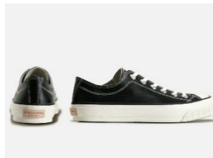
RUBEAR NR ソールの「SPM-341」