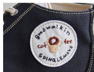
刺繍ワッペン「コーヒー」