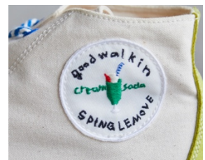
刺繍ワッペン「クリームソーダ」