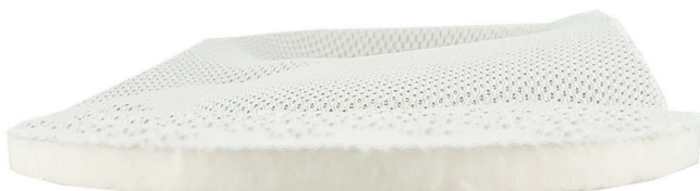
アーチサポート ※インソール(正面)