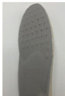
インソール前部には通気穴