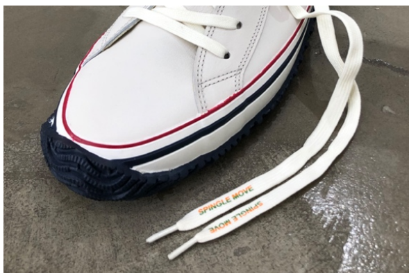
ロゴ入りオリジナルシューレース