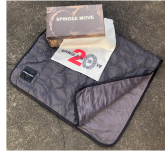
専用スペシャルボックスと特製シューズバッグ、キルティングブランケット兼ポンチョ

SPINGLE MOVEの20周年記念モデルは、広島県府中市の本社工場にあるバルカナイズ製法の釜をプリントした専用スペシャルボックスに入っています。さらに、今回は特製シューズバッグ、スポーツ観戦など野外で活躍するキルティングのブランケット(兼ポンチョ)がついています。