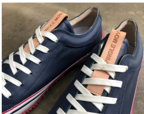
ヌメ革ループとスポンジ入り履き口