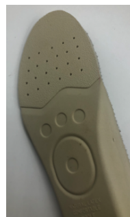
ラテックススポンジ製 ※インソール(裏)