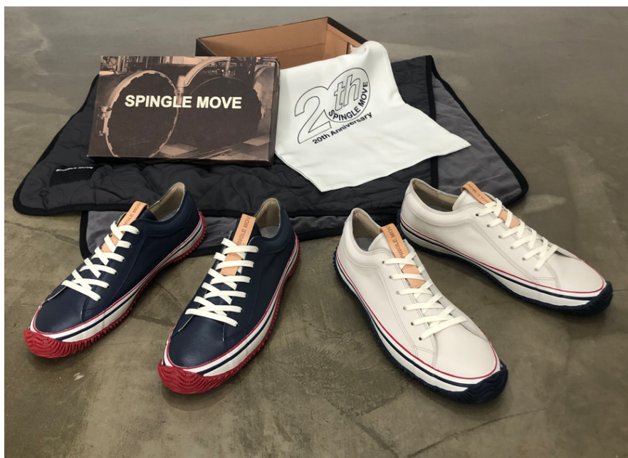
SPINGLE MOVE 「SPM-1020」

株式会社スピングルカンパニー(本社：広島県府中市、代表取締役社長：内田貴久)は、デビューから 20 周年を迎えた「SPINGLE MOVE(スピングルムーヴ)」の記念モデルとして、新しい履き心地の追求をコンセプトに、新開発のインソールを搭載しソフトな履き心地を実現したスニーカー「SPM-1020」を 2022 年 12 月 28 日から発売します。