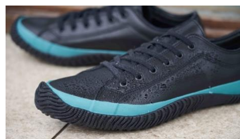
GORE-TEX ファブリクスを使用した「SPM-619」

国内でも貴重なバルカナイズ製法と GORE 社の認定工場としての高度な技術力を組み合わせ、雨の日や雪の日でも活躍する防水・透湿性能を追求した商品を「SPINGLE Biz」と「SPINGLE MOVE」の中からご紹介いたします。