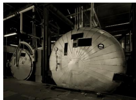
バルカナイズ製法の要となる釜