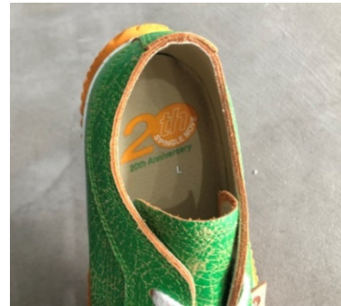
20周年記念ロゴをプリントしたインソール