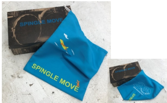
オモテ ウラ 専用スペシャルボックスと特製シューズバッグ

SPINGLE MOVE の 20 周年記念モデルは、広島県府中市の本社工場にあるバルカナイズ製法の釜をプリントした専用スペシャルボックスに入っています。さらに、20 周年記念ロゴをプリントしたインソール、2022SS シーズンテーマ「Re;sort/リゾート」になぞらえ、リゾート地へ旅立つ旅客機をプリントした特製シューズバッグがついています。