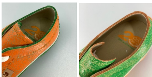
アッパーにはコーポレートカラーのクラッキングレザーを採用