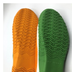
ソールのゴムもコーポレートカラーを再現