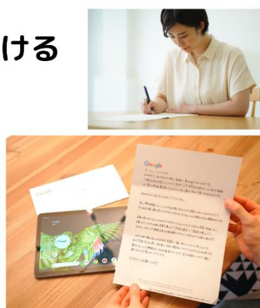
支援事例) Google合同会社さま

企業合宿後に「感謝のお手紙」を届けます。 直筆のお手紙は「また利用したい」と感じていただける、 直接的なレポート施策にもなります。 お客さまのためだけに時間を割いたお手紙は、 感情的にも刺さりやすく、ずっと記憶に残り続けます。