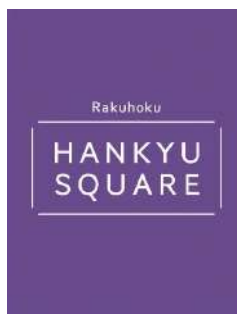
洛北阪急スクエアロゴ