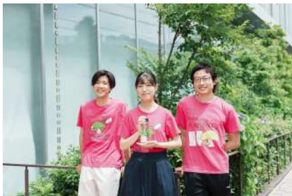
エコ〜ると京大の学生

[エコ〜ると京大]京都大学の学部生、院生による学生団体。プラスチックの削減やプラスチックとの上手な付き合い方を紹介する「京都大学プラ・イド革命」をはじめ、「マイボトルダンス」というオリジナルの歌と踊りを作って環境問題に取り組む。マイボトル普及のために学内にウォーターサーバーを設置する働きかけも行う。