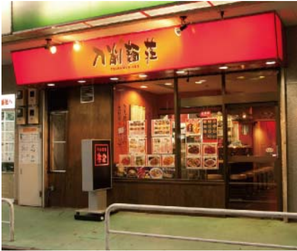
「刀削麺荘 唐家 錦糸町店」