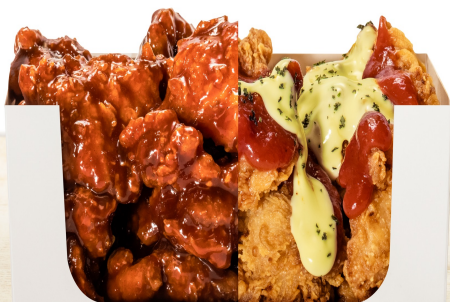
ハーフ&ハーフ 300g：¥1650 600g：¥2800

※写真は 激辛 / トマトチーズ のハーフセット(300g) たくさんのメニューから、お好みのチキンを2種類セレクトできる、欲張りメニューです。迷ったらコレ！ 様々なバリエーションを楽しみたい欲張りなあなたにおススメの商品です。