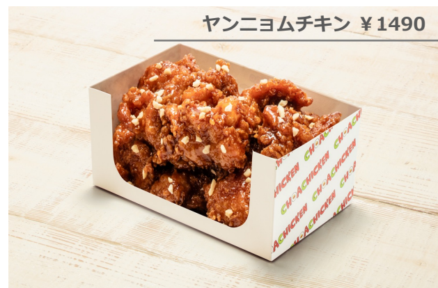
ヤンニョムチキン ¥1490

韓国チキンの王道メニュー！ソースにこだわる チョアチキンの基本の味をお楽しみください。