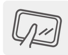
タッチ&amp;スクロール