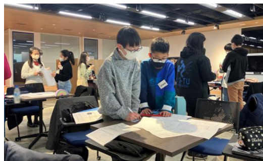
ワークショップ風景（イメージ）