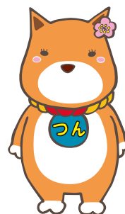
薩摩川内市公認キャラクター 西郷つん

① 9:30～10:30 ②11:00～12:00 ③13:30～14:30 ④15:00～16:00