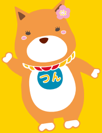
薩摩川内市公認 キャラクター 西郷つん