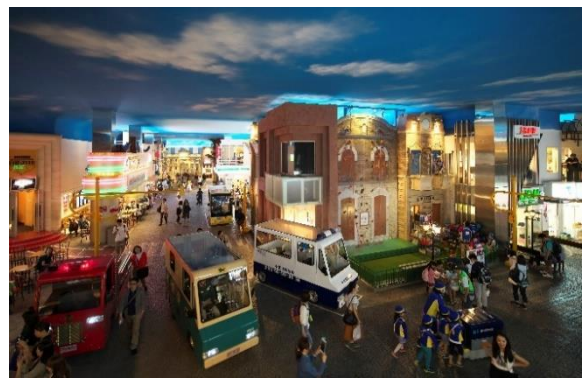
キッズニア東京

本パビリオンでこども達は、ジュエリーデザイナーとして、カルティエの伝統的なデザインをもとに作品を完成させます。ブティックで実際に採用しているインテリアをとり入れた明るい空間が広がるパビリオンで、こども達は、アクティビティを通して、カルティエの歴史や伝統についての知識を深め、普遍の美を追求するカルティエのモノづくりを学びます。