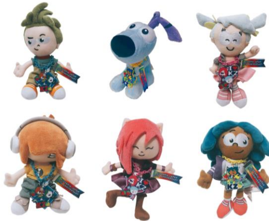
限定キーホルダー付ぬいぐるみ 価格：1,690円（税込み）