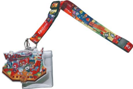
限定ぱっちゃんストラップ 価格：1,100円（税込み） ※8月上旬より販売開始

アクティビティの受付・予約をするためのJOBスケジュールカードを収納できる「ぱっちゃんストラップ」、ネックレスのように首から下げたキーホルダーがかわいい「限定キーホルダー付ぬいぐるみ」など15周年の限定グッズも続々登場。キッズニア内でオリジナルグッズを販売しているナショナルストアで購入できます。