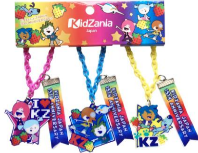
限定 キーホルダー 3個セット 価格：1,150円（税込み）