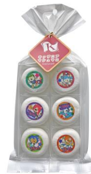
限定マシュマロ 価格：350円（税込み）