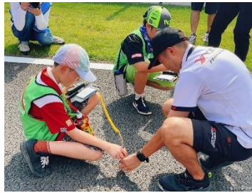
レーシングタイヤサービス