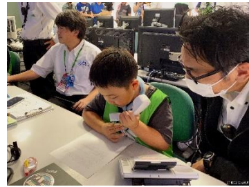
管制オフィシャル

「Out of KidZania in SUPER FORMULA 2023」実施時の様子