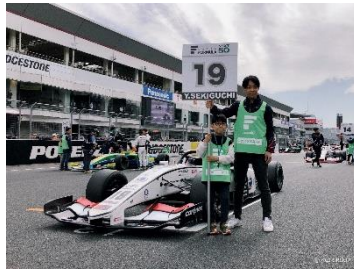
グリッドボードホルダー