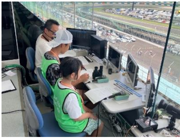
場内アナウンサー