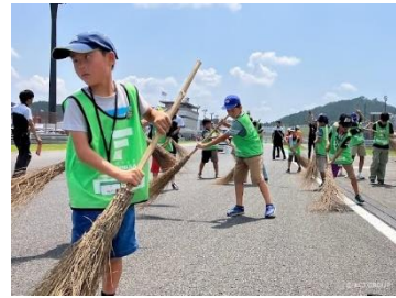
コースオフィシャル