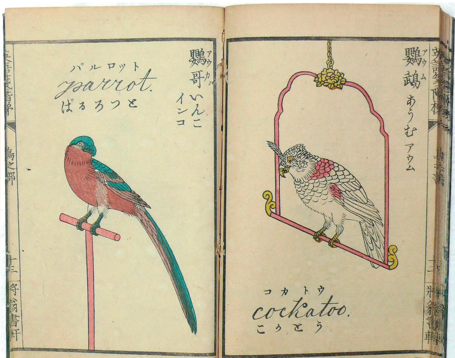
絵入英語箋階梯 鳥之部 安部喜任著 服部雪斎画 慶応3年(1867)8月 将翁書軒藏