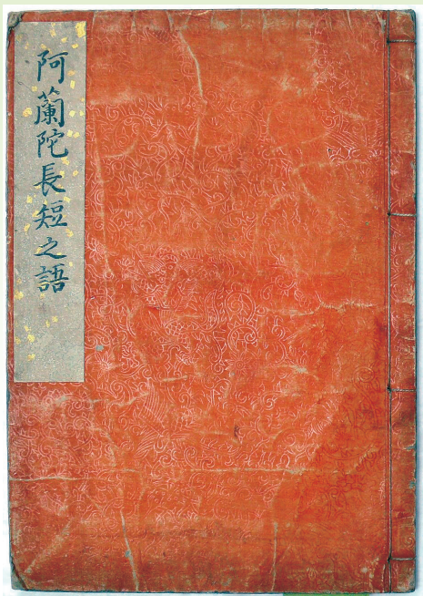
阿蘭陀長短之語 著者・書写年不詳 19世紀初頭か

私たちは外国語を学ぶとき単語を覚えます。実は「単語」は江戸時代にオランダ語のエンケルウォールト(enkel word)の訳語として生まれました。外国語の単語に与えられた訳語の変遷から、私たちは異文化交流の歴史を知ることができます。本展示では、神田佐野文庫から、長崎のオランダ通詞たちの単語帳、蘭書翻訳に従事した蘭学者たちの単語帳や辞書、文明開化期の英単語帳など、関係資料29点を選び、異文化交流の諸相を考察します。