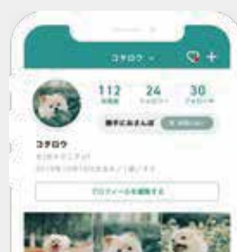
ぺっとひろば プロフィール