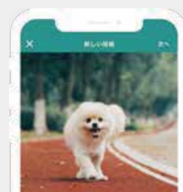
ぺっとひろば 新規投稿