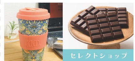
セレクトショップ

400種類を超えるピンバッチが並びます！オーダーもお受けしておりますのでお気軽にお問い合わせ下さい♪