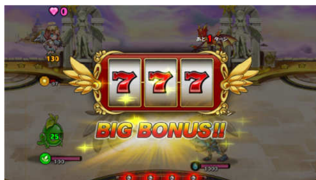
「スフィア(球体)」を消すことでスロット出現も！