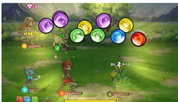
ユニットの攻撃パワーとなる「スフィア(球体)」

バトルの最中にはユニットの個性として戦闘に様々な効果をもたらす「スキル」が発動。この「スキル」発動タイミングや、ユニットの属性を考え、戦う仲間の選定から戦略を練ることも攻略のポイントです。また、バトルの最中には「スロット」発動もあり、「スフィア(球体)」のフィーバー発動やアイテム獲得により、バトルをより有利に進めることもできます。