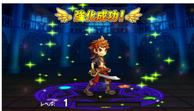
強化合成を行い、最強のユニットを作ろう！