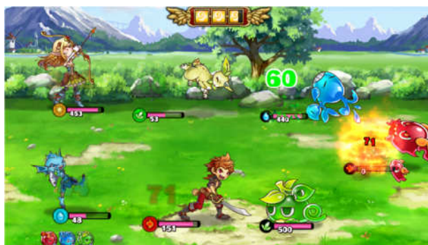
パーフェクトスラッシュ目指して斬り倒せ！